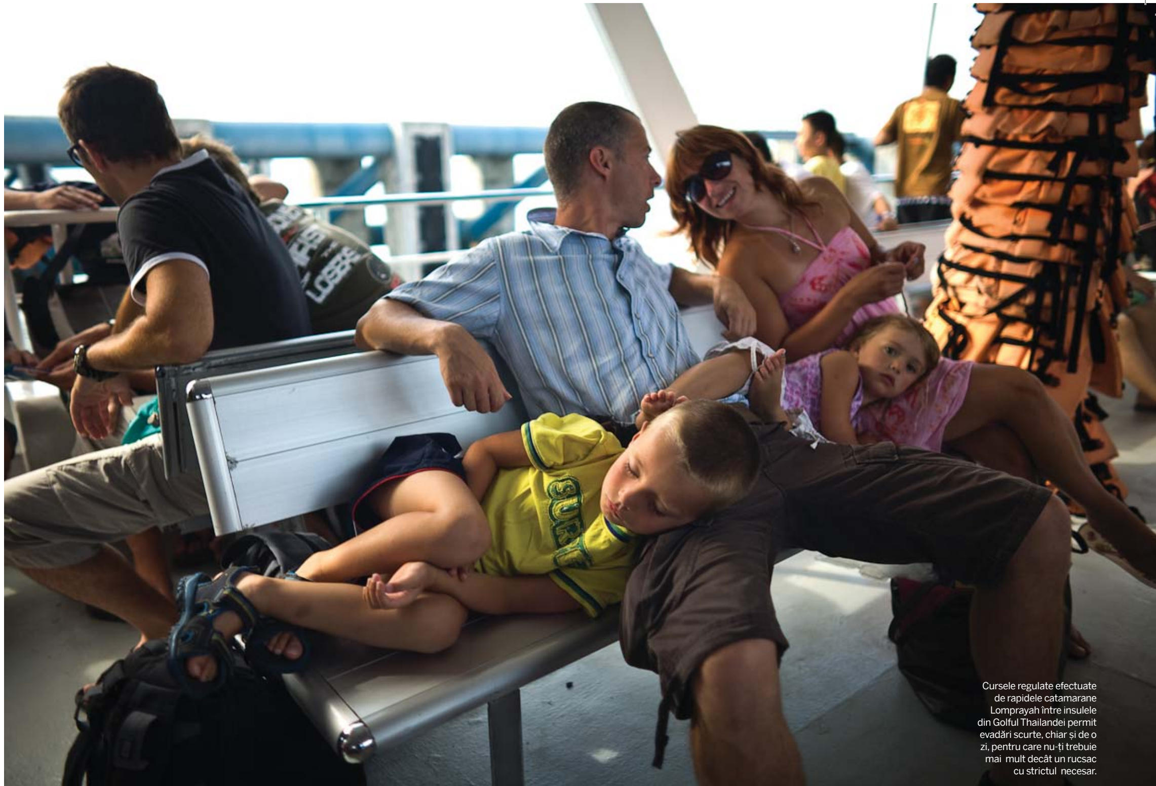
Cursele regulate efectuate de rapidele catamarane Lomprayah între insulele din Golful Thailandei permit evadări scurte, chiar și de o zi, pentru care nu-ți trebuie mai mult decât un rucsac cu strictul necesar.

ție pașaportul, au scutere mai bune, nu te ard dacă mai cazi și le strici mașinăria... Un francez pe care tocmai l-am cunoscut mi-a povestit că a avut un mic accident zilele trecute – a lovit oglinda dreaptă – și a trebuit să plătească o suprataxă de 1000 THB.