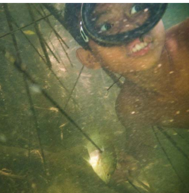
Un băiat thailandez pescuiește scufundându-se cu o țepușă într-un râu din Regiunea Suratthani (deasupra). O fetiță se joacă cu câinele bunicii, o doamnă originară din Olanda, care acum locuiește în Samui (dreapta).

În insula asta s-a adunat o mână de europeni care și-au făcut afaceri și nu mai pleacă. Nu cred că sunt calați pe profit, ci pentru a putea trăi aici. Sunt niște suedezi, cu un restaurant mic unde bei o cafea bună, un italian fascinant, cu o pizzerie și un bar deschis doar miercuria, nemții, cu locul pentru copii, și niște francezi care au o brutărie. Eu prefer totuși să-i frecventăm pe thailandezi. Avem deja prieteni la