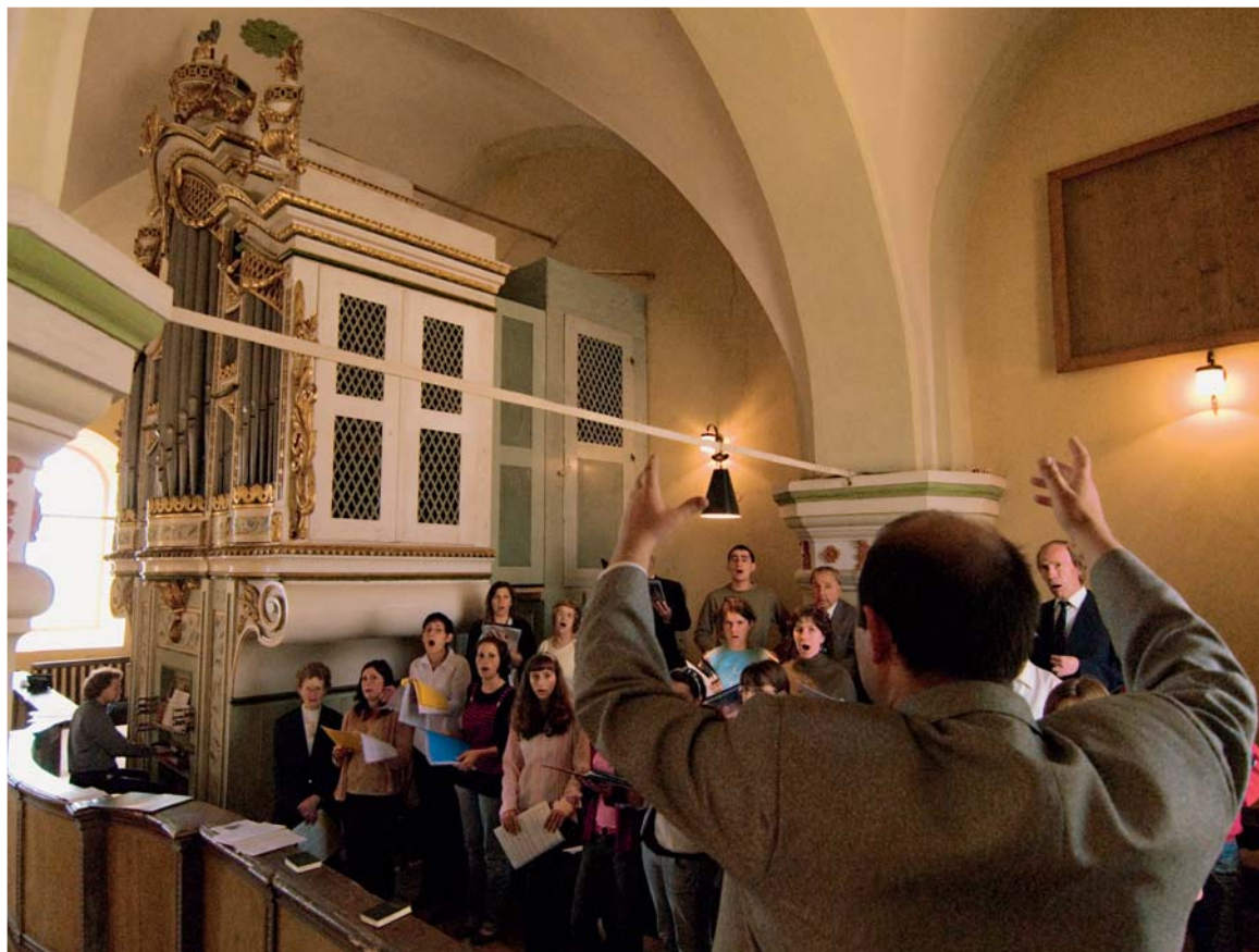
Orga din Hălchiu, care acum acompaniază un imn cântat de cor, este al șaselea instrument istoric restaurat de fundația din Hărman. Alte două, dintre care prima orgă nouă construită în România după război, se află în lucru.

Mai târziu, peste o mică „secțiune” din această comunitate orga își etalează, în lumina filtrată din biserică, toată forța sonorității ei de baroc întârziat, cu buchetul a două secole bătute pe muchie. □